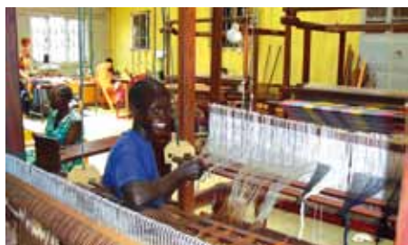
Blick in die Webwerkstatt in Lomin.

gegriffen und eingesetzt. Die Produkte werden hauptsächlich vor Ort verkauft, finden aber auch großen Anklang in der Hauptstadt Juba, in anderen Städten und im benachbarten Uganda. Diese Frauenwerkstätte ist eingebunden in einen größeren Werkstattbereich der Comboni Missionare. Schritt für Schritt lernen sie ihre Produkte selbst zu vermarkten. Dabei arbeiten sie mit großer Kreativität und haben viel Spaß beim Arbeiten. Es wird eine Möglichkeit geben Lesen und Schreiben zu erlernen. Ebenso ist eine zukünftige Zusammenarbeit mit Schulen geplant.