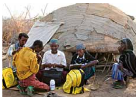
Das SONNE-Team im Gespräch mit den SozialarbeiterInnen.

in den Bereichen Hygiene, Frauenrechte und Frauengesundheit. Ziel ist es die Genitalverstümmelung komplett aus der Gesellschaft zu verbannen. Um dieses Ziel zu erreichen werden auch religiöse Führer und