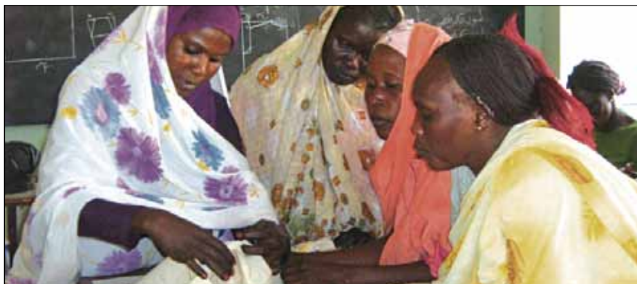
Die Lehr-Schneiderei in Wau Nursoll neue Einkommen schaffen und die geschickten Flüchtlingsfrauen aus Sudan vor Haftstrafen wegen illegaler Hausbrauereien bewahren.

Kriege und Dürre sind eine schwere Last für die Menschen im Sudan: Mehr als vier Millionen mussten ihre Heimat verlassen oder wurden aus ihren Dörfern vertrieben. Tausende Menschen leben in Flüchtlingslagern. Besonders dramatisch ist die Situation der Kinder in den Flüchtlingslagern in der Wüste: Sie sind besonders anfällig für Krankheiten wie Malaria, Durchfall und Tuberkulose. In der Vergangenheit litten die Kinder in den Lagern in der Wüste unter so gravierender Unterernährung, dass sie teilweise irreversible Hirnschäden davongetragen haben. Die Caritas-Auslandshilfe kooperiert eng mit der Vinzenzgemeinschaft vor Ort.