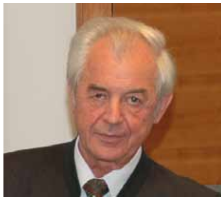
Josef Riegler bei der Enquete Entwicklungszusammenarbeit des Landtag Steiermark 2008