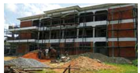
Der Schulneubau schreitet zügig voran