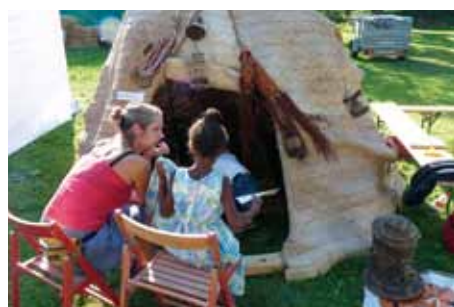
Schülerin beim Unterricht. Besonders wichtig ist es auch den Afar-Mädchen die Schulbildung zu ermöglichen.

Aufbauend auf unser vorangegangenes Alphabetisierungsprogramm, bei dem bisher mehr als 10.000 Kinder und Jugendliche lesen und schreiben gelernt haben, sind nun in den abgeschiedenen Projektbezirken der Afarregion im NO Äthiopiens 30 Lehrer im Einsatz, um zirka 2000 Kindern eine mehrjährige Volksschulbildung zukommen zu lassen. Es ist nicht einfach den Unterricht auch in Zeiten der Dürre aufrechtzuerhalten. Wasser-