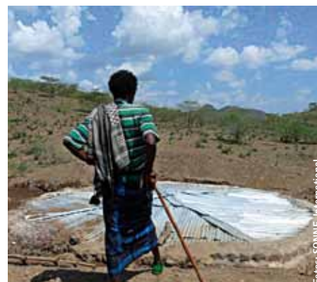
In der Wasserzisterne (Birikuit) wird Regenwasser gesammelt.

Standort wurde ein „Wasserkomitee“ gegründet (aus jeweils 5-6 Mitgliedern der lokalen Bevölkerung), das sich um die Sicherung, den Erhalt und die Reinigung der Wasserspeichieranlagen kümmert und eigenverantwortlich für die notwendigen Instandhaltungsmaßnahmen und auch Reparaturen zuständig ist. Damit die Zisternen, Dämme und die Regenwassersammelanlagen lange und gut funktionieren.