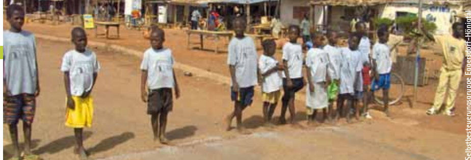
Kinder vor der Schule in Yansare, deren Bau durch die Selbstbesteuierungsgruppe Eggersdorf-Hönigstal unterstützt wurde.

Selbstbesteuierungsgruppe Eggersdorf-Hönigstal