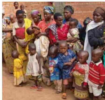
Warteschlange bei der Essensausgabe.

Ein anderes Land, ein ähnliches Problem: Im Waisenheim in Kavumu/Burundi, das 90 Kinder beherbergt und weitere 212 bei Pflegefamilien unterstützt, wollen die Schwestern eine eigene Landwirtschaft zur Selbstversorgung einrichten. Der Boden ist vorhanden. Abgestimmt auf die Bedürfnisse der zu pflegenden Kinder sollen Kartoffeln, Soja, Früchte und Gemüse angebaut werden. Die Caritas-Auslandshilfe unterstützt die Anschaffung von Saatgut bzw. Keimlingen, Dünger und Pflanzenschutzmitteln.