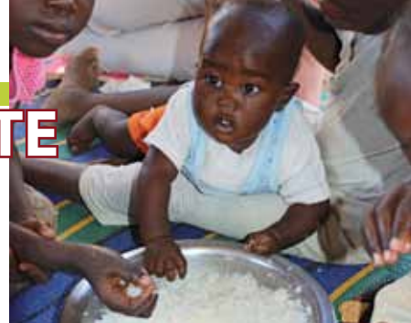
Mittagessen im Baby Feeding Center.