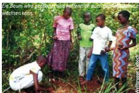
Ein Baum wird gepflanzt und hoffentlich auch gepflegt, damit er wachsen kann.

Das Projekt „Green Friends for Rivers“ wird durchgeführt von YEN (Youth Educational Network) in Kenia. YEN hat in diesem Projekt drei Baumschulen gegründet. Die Setzlinge werden abgegeben an Familien und Kommunen, teilweise werden damit Flussufer begrünt. Gleichzeitig werden die Ufer des Lairi-Flusses gereinigt, um langfristig die Wasserqualität zu verbessern. Alle Arbeiten erfolgen in Zusammenarbeit mit Kommunen und lokalen Behörden auch diverse Jugendgruppen sind eingebunden. Dieses Projekt wird im Jahr 2010/ 2011 vom Land Steiermark unterstützt.