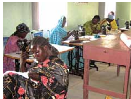
Der erste Nähkurs in Kassala.

sorgen. Die Pfarre Wau Nur richtete deshalb ein Berufsausbildungszentrum ein, um neue Erwerbsquellen zu erschließen. Weitere Berufsausbildungsmöglichkeiten sollen folgen. In der neuerrichteten Näherei erwerben Frauen durch die Teilnahme an Nähkursen Fertigkeiten und Wissen, wie Nähen und Färben von Stoffen, Management und Geschäftsführung. Dieses Projekt ist Hilfe zur Selbsthilfe. Die Frauen können sich nun durch Nähen eigenständig ihren Lebensunterhalt verdienen und die Kenntnisse auch für den Eigenbedarf wie beispielsweise dem Nähen der Schuluniformen für die Kinder nutzen. Das Projekt fördert durch das eigene Einkommen auch die Unabhängigkeit der Frauen von ihren Männern.