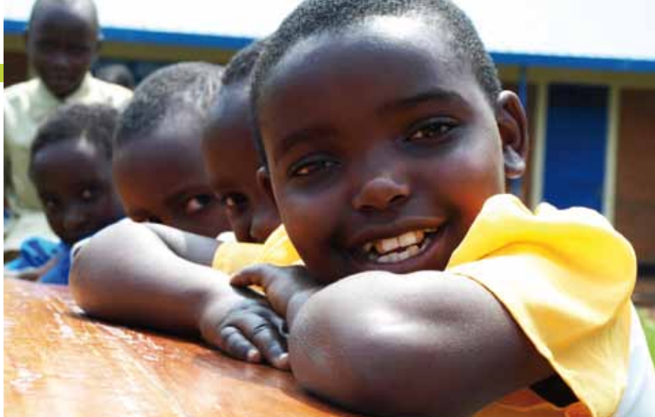
Mit großem Erfolg konnte der Wiederaufbau einer Primärschule, die wie viele andere Schulen und Gemeinschaftsräume bei dem schweren Erdbeben im Februar 2008 in Ruanda zerstört wurden, abgeschlossen werden.

Auf dem Weg zum Schulzentrum, am Fuße des kleinen Hügels, standen noch die alten Schulräume, die die UNICEF kurz nach dem Erdbeben 2008 aufgebaut hat, um den Schulbetrieb aufrechterhalten zu können. Links sieht man bereits die vielen neuen Schulräume, einige sind noch in Bau. Auf der rechten Seite hingegen sind noch weitere alte Holzbaracken in sehr schlechtem Zustand zu finden, teilweise einsturzgefährdet, teilweise dunkel und bei Regen nass. Nun gibt es bereits wieder 13 neue Klassenräume. Doch es fehlen noch immer überall im Land Klassenräume. Nicht nur das Erdbeben, sondern auch die hohe Überbevölkerung ist in Ruanda ein großes Problem. Es gibt nicht genug Schulen und die Familien sind arm. In manchen Regionen gehen nicht einmal 30 Prozent der Kinder in die Schule. Der Bedarf nach Ausbildungsstätten ist groß und immer mehr Kinder und ihre Familien wünschen sich Möglichkeiten, eine angemessene und zukunftssträchtige Ausbildung zu erhalten. Klar, dass die Eröffnung der neuen Schul-