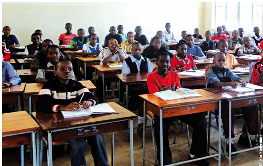
Der Arbeitskreis Weltkirche hat die St. Amedeus Secondary School bei Himo-Town, Tansania, unterstützt. Nun werden in Workshops im Comboni-Missionshaus in Graz-Messendorf zum Fairtrade-Tag die Erfahrungen aus der Entwicklungszusammenarbeit gezeigt.

Der Arbeitskreis Weltkirche der Pfarre Graz-St. Andrä wird zum Fairtradetag des Landes Steiermark in einer eigenen Ausstellung im Comboni-Missionshaus in Graz-Messendorf seine eigenen Projekte präsentieren: Es geht um Kindergärten, Berufsschulen, Hauptschulen, Erwachsenenbildung genauso wie um HIV/Aids- und Wasserleitungsprojekte. Dies gibt einen Überblick über 15 Jahre Entwicklungszusammenarbeit dieser Initiative.