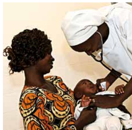
Ein Drittel der Babys, die angesichts schwerer Unterernährung ins Zentrum kommen, sterben in den ersten Wochen nach der Geburt.

Das Gesundheitszentrum wird von zwei Orden geführt: den Brüdern vom Heiligen Johannes und den Schwestern vom Heiligen Herz Mariens. Mit Hilfe von Missio soll das Gesundheitszentrum nun ausgebaut werden. Im Vordergrund stehen Schritte, um Kinder durch bessere Ernährung eine Grundlage für Gesundheit zu geben. Die Mütter erhalten Schulungen in den Bereichen Gesundheit, Hygiene und Ernährung.